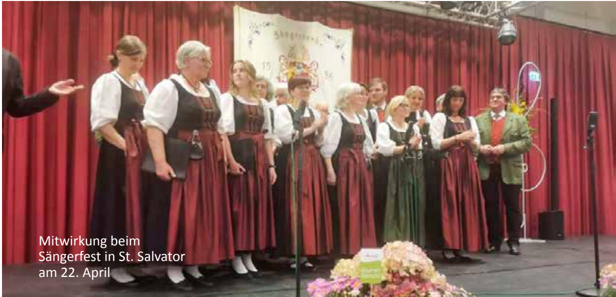
Mitwirkung beim Sängerfest in St. Salvator am 22. April

Im Jahr 2023 erlebte der Gemischte Chor Sirnitz erneut ein wunderbares und erfolgreiches Vereinsjahr. Der Chor bereicherte mit seinem Gesang zahlreiche gesellschaftliche und kirchliche Veran-