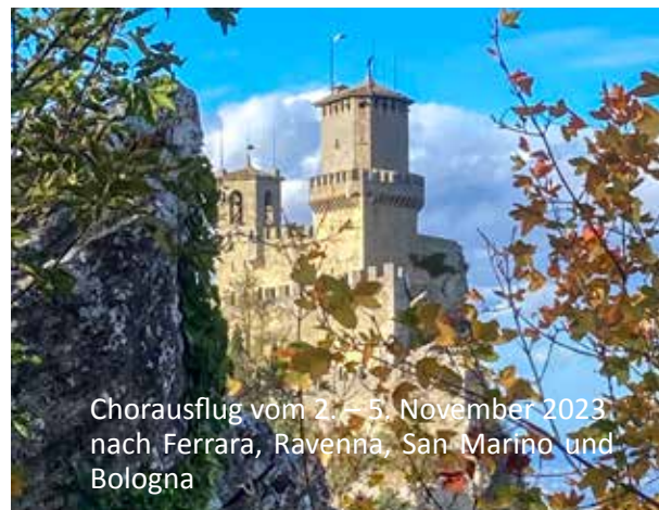
Chorausflug vom 2. – 5. November 2023 nach Ferrara, Ravenna, San Marino und Bologna