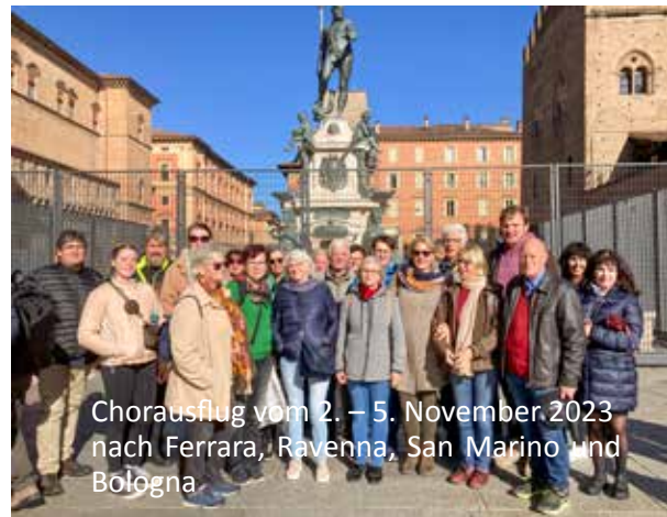
Chorausflug vom 2. – 5. November 2023 nach Ferrara, Ravenna, San Marino und Bologna