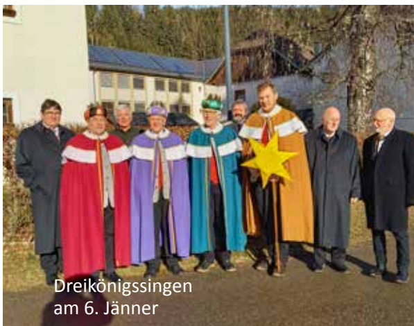
Dreikönigssingen am 6. Jänner